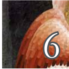
Poésie Existence Spiritualité