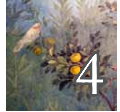
La joie malgré tout, la joie sur le fil du rasoir