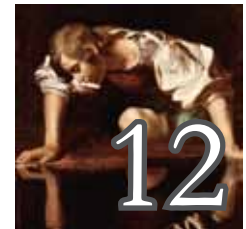
Ressemblance / Ressemblances