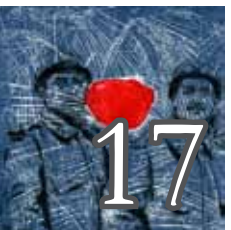
Guerre et paix