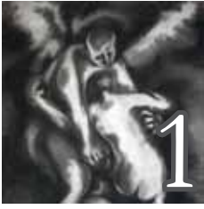
La lutte avec l'ange