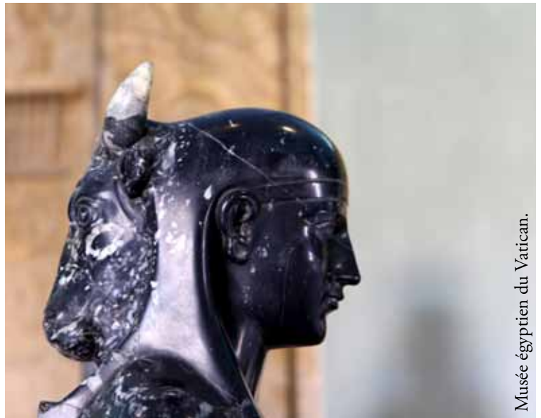
Musée égyptien du Vatican.

Replacer l'autre au cœur de la littérature pour mieux vivre ensemble dans un monde meilleur.