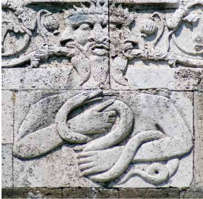
Revue publiée par l'Atelier GuyAnne, association artistique et littéraire.