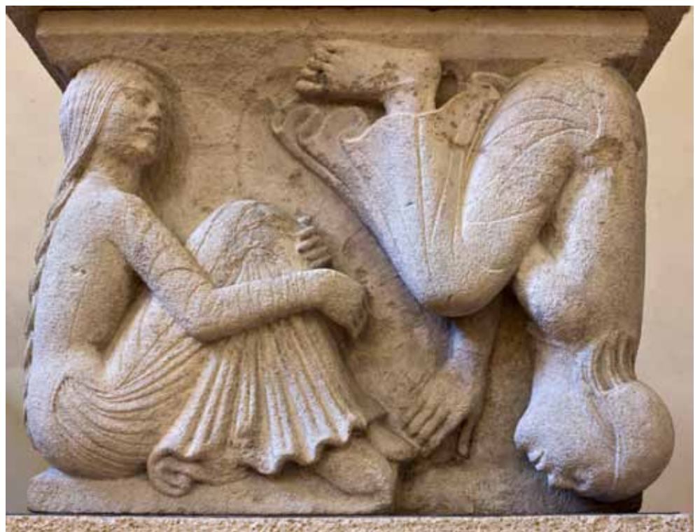
Wiligelmo, Les Antipodes . Musée du Dôme, Modène.

Enjeu constant, non seulement de l'œuvre artistique et poétique, mais de l'existence en ses différentes sphères, individuelle ou collective, l'altérité se manifeste dans la parole, s'y révèle et s'y construit. Dans une optique dualiste, elle est rapidement conflictuelle. Dans une perspective ouverte, elle stimule la générosité créatrice.